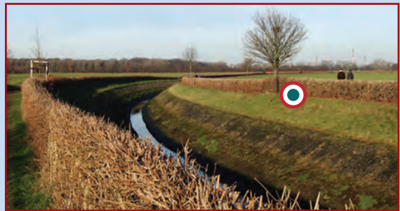
Hecke N Sinnersdorf; Aufn. 12. Januar 2014 Blick nach Nordost auf Chemiepark