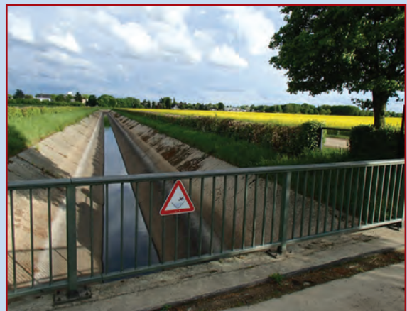
Hecke und Brückengeländer mit Warnschild; Aufn. 10. Mai 2013 Blick nach Süden auf Widdersdorf

Der Großteil dieser Hecke steht bereits seit dem Bau des Kölner Randkanals Mitte der 1950er-Jahre und dient der Abgrenzung gegenüber Mensch und Tier. Der Feldahorn kann 150 bis 200 Jahre alt werden, wächst auf einer Vielzahl von Böden, kommt mit Stadtklima, Industriebelastung und auch leichter Streusalzbelastung zurecht. Er verträgt zudem den jährlichen Rückschnitt, der als Pflegemaßnahme vor allem im Herbst erfolgt.