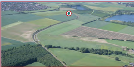
Kanalverlauf am Modellsegelflugplatz bei Sinnersdorf; Hecken und Solitärbäumen; Schrägluftbild ZKR